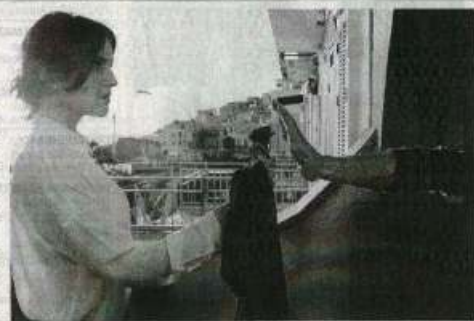
Uno scatto della mostra